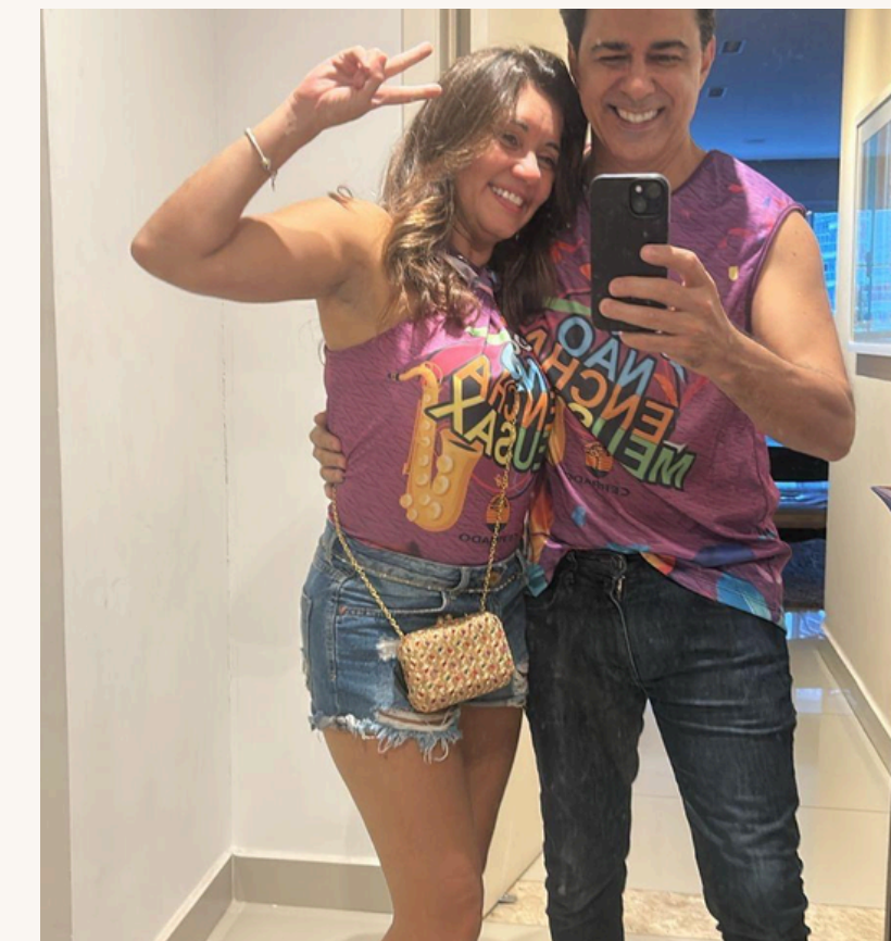
DEPOIS DO DIAGNÓSTICO

"Hoje ele me entende. Ele fala antes de eu esquecer, porque ele é o meu suporte."